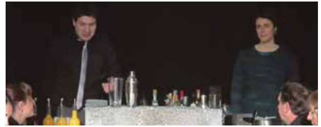
Taller de cocteleria amb Cal Feru i Cal Mitjans

El caràcter solidari ha tornat a estar present en les festes. En diferents moments de la programació es van poder recollir aportacions econòmiques a benefici d'AMPERT, entitat que dona suport a la comarca a malalts de càncer. Els diners recaptats han estat 600 euros. La presència intermitent de pluja diumenge al matí va comportar que la cercavila es substituís