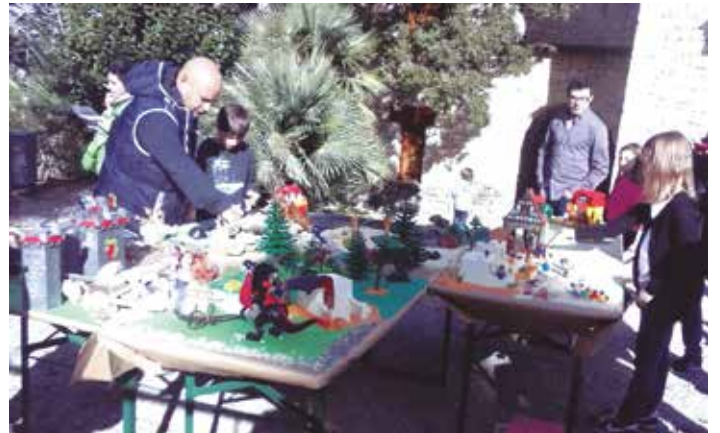
En l'activitat hi van participar una cinquantena de persones

Els clicks de Playmobil són ninotets universals i tenen una àmplia parròquia a casa nostra. Bona mostra d'això va ser l'èxit de convocatòria de l'activitat que es proposava diumenge 26 de gener al matí, a la seu d'Olèrdola del Museu d'Arqueologia. Es demanava que es portessin clicks de Playmobil, amb els seus complements, per a elaborar un diorama ambientat en l'època medieval. A la crida hi van respondre una cinquantena de persones que van fer possible l'elaboració d'un complet diorama. L'activitat s'inscriví dins de l'exposició "Playstories. Juga i aprèn amb els clicks", que s'ha pogut veure fins l'1 de febrer al castell d'Olèrdola.