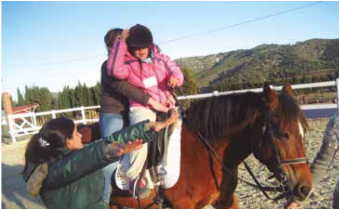
El servei l'ofereix l'Escola Pony Club Granja

La satisfacció era la nota predominant entre les famílies que dissabte 21 de desembre participaven en una jornada de portes obertes, convocada a l'Escola Pony Club Granja de La Serreta, per a presentar el nou servei d'equinoteràpia que ofereix aquesta hípica del nostre municipi. El propòsit era el de donar a conèixer aquest nou servei, basat en els beneficis terapèutics que pot reportar el contacte amb els cavalls, especialment en persones amb discapacitats psíquiques o físiques.