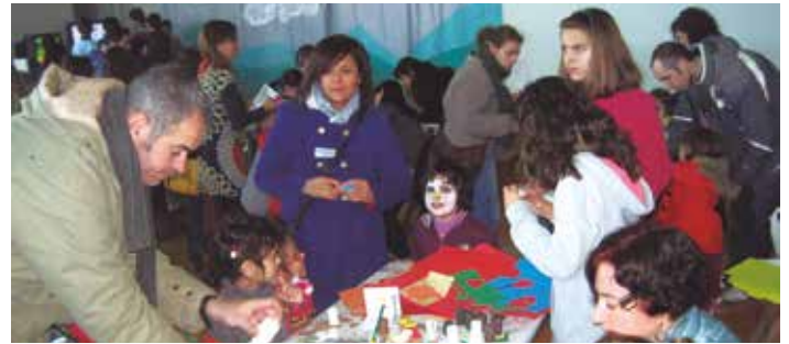
Tallers solidaris organitzats per l'AMPA de l'escola Circell

Diumenge a la tarda, en l'estrena de l'obra "Revisió Anual" del grup local El Folre de Sant Pere Molanta, es recaptaven 657 euros. El mateix diumenge a la tarda, al Local Nou de Moja, els clubs de Rítmica i d'Aeròbic d'Olèrdola oferien una exhibició. Amb l'organització compartida amb el Grup de Joves de Moja, assolien reunir més de 500 persones i recaptar 1.117 euros.