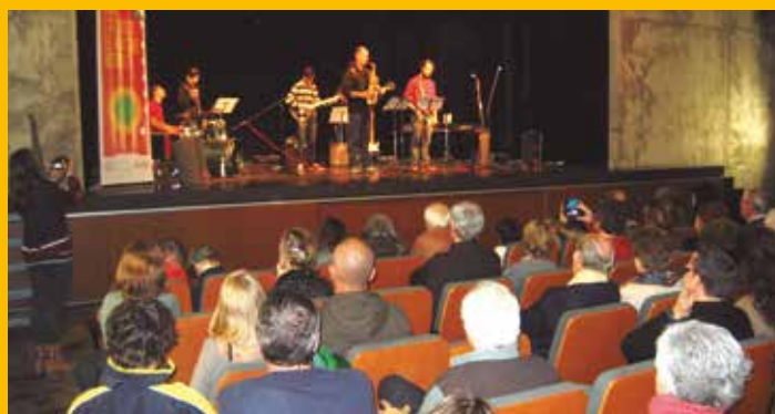
Festes de Sant Macari marcades per la solidaritat