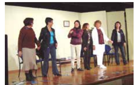
El públic va agrair l'esforç de les actrius

Sant Pere Molanta va respondre com en les millors ocasions i diumenge 15 de desembre a la tarda el Casal Molantenc es va omplir per a seguir l'estrena de l'obra "Revisió Anual", a càrrec del grup El Folre. El grup de casa mostrava davant el seu públic la feina feta per a donar vida a aquest text de Montserrat Cornet, després de començar a assajar el muntatge el mes de juny. En clau de comèdia, l'obra planteja la relació que van teixint en la consulta d'una metgessa tres dones de diferents característiques i condicions. Un públic predisposat va connectar amb la proposta i les rialles van acompanyar la representació en forces passatges de l'obra.