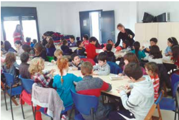
Moment de la sessió al Centre Cívic Gatzara

Els tallers de "jumping clay" que ha organitzat l'Ajuntament d'Olèrdola han superat les expectatives inicials d'inscripcions. Sumant les tres cites convocades, entre dilluns 30 i dimarts 31 de desembre han estat més de 120 els infants que han estat apuntats per a participar en aquests tallers gratuïts de manualitats. Aquests tallers nadalencs han estat convocats a iniciativa de les regidories de joventut i cultura de l'Ajuntament d'Olèrdola, amb l'ànim d'oferir als infants una activitat durant les vacances d'hivern.