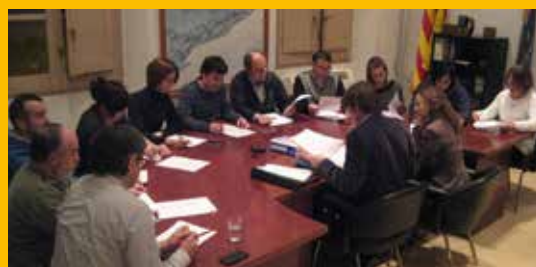
Suport unànime de l'Ajuntament a la consulta per la independència