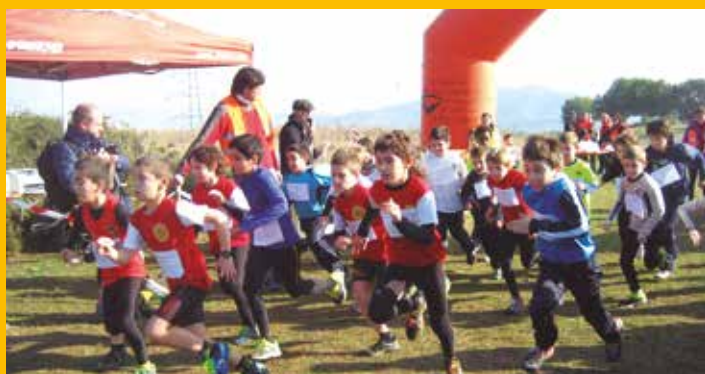
El Cros de Moja reapareix amb èxit