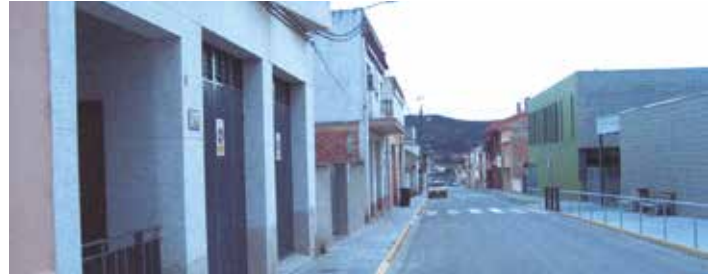
Les obres al carrer Wilson es preveuen fer aquest 2014