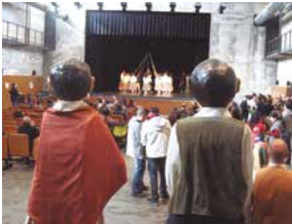
Els balls van actuar al Local

Malgrat el condicionant que ha suposat el temps, des de la Comissió de Festes de Moja s'ha fet una valoració satisfactòria de les Festes de Sant Macari, celebrades del 17 al 19 de gener. La col·laboració rebuda per part d'entitats i veïns, així com el desenvolupament de