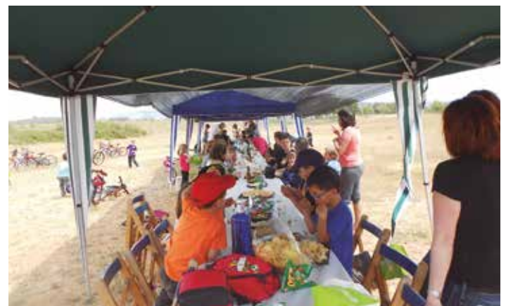
La Festa acabava amb un dinar de germanor

A partir de les 11 del matí es van anar succeint les proves de btt programades. S'hi van inscriure 35 infants de l'escola i es van poder fer les curses de parvulari i les dels cicles inicial, mitjà i superior. Es van repartir medalles de record per a tots els participants i els tres primers classificats de cada categoria van rebre copa. Després de l'acte de lliurament de premis, tenia lloc un dinar que va reunir a un centenar de persones.