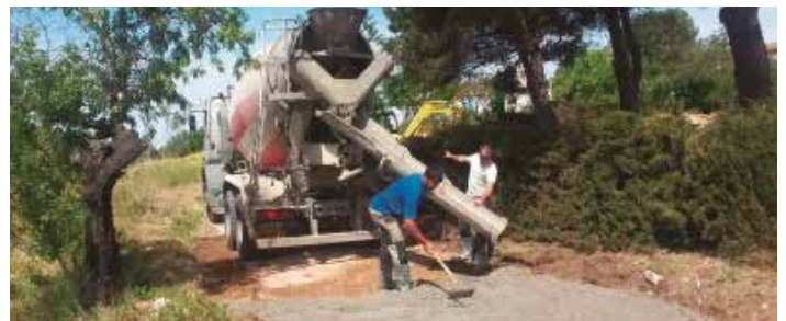
La millora recull una petició dels veïns

Dins de les tasques de manteniment i millora que es realitzen a la via pública del municipi, durant la primera setmana de maig l'Ajuntament d'Olèrdola ha completat intervencions d'arranjament en el camí asfaltat que uneix els barris de Can Segarra i Cal Moles. Una empresa especialitzada contractada per l'Ajuntament ha procedit a substituir el ferm en dos trams malmesos del vial. També s'han reparat laterals que presentaven desperfectes per l'acció de les branques dels arbres i s'ha procedit a pavimentar una rampa d'accés des de Cal Moles a l'Arboçar.