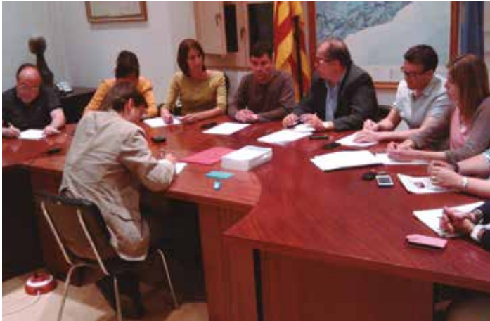
Les inversions milloraran serveis bàsics del municipi

Es certifica el baix endeutament de l'Ajuntament, que era del 21% del pressupost en tancar-se el 2013