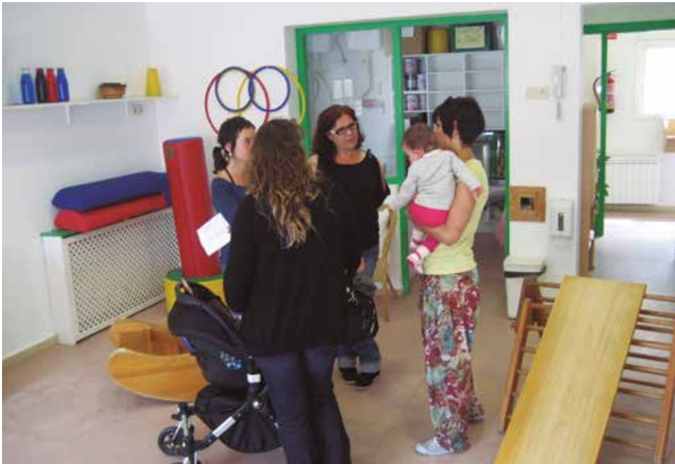
El 26 d'abril es va fer jornada de portes obertes a les escoles bressol

Les escoles bressol municipals d'Olèrdola es promocionen als polígons del municipi. El propòsit és que les persones que hi treballen tinguin present que les escoles bressol Gotims de Moja i El Pàmpol de Sant Pere Molanta són molt bones opcions en cas de necessitar els serveis de llars d'infants pels seus fills, encara que no visquin a Olèrdola. Difondre aquesta possibilitat ha estat un dels missatges que s'han transmès durant la jornada de portes obertes que s'ha fet a les escoles bressol d'Olèrdola, dissabte 26 d'abril.