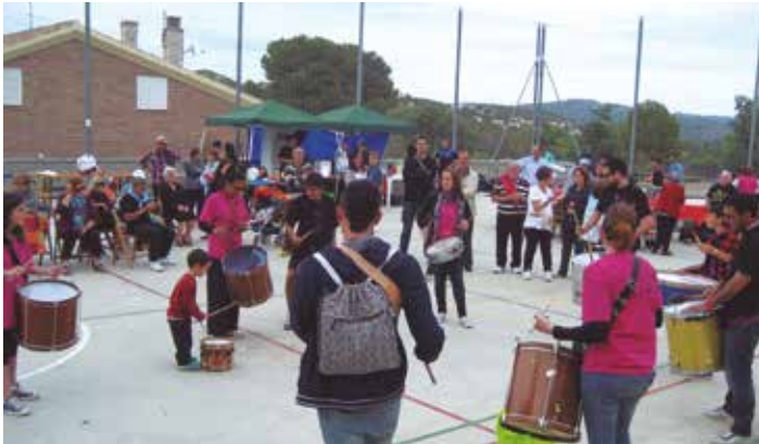
La festa va incloure l'actuació de la Batukada d'Olivella

La Festa de la Primavera ocupa un lloc ben assenyalat dins del calendari festiu de Can Trabal. En l'edició d'enguany, celebrada dissabte 24 de maig, aquesta importància es va posar