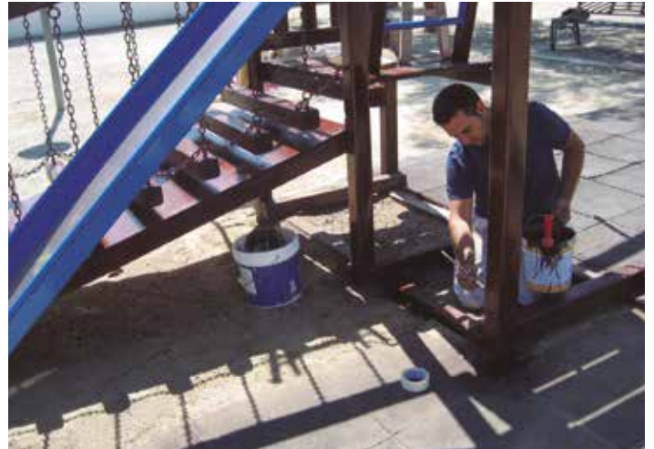
Es repintaran els 180 bancs instal·lats al municipi

El material es preveu reparar a les places d'Olèrdola i de l'Olivera, així com en el sector de la Vinera, a Moja; a la plaça de l'Església a Sant Miquel i a la plaça Montserrat Roig, a Sant Pere Molanta, així com al barri de Rectoria i a les zones d'equipaments de Daltmar i Can Trabal. Els nous jocs infantils es començaran a posar a Moja, Sant Miquel i Sant Pere Molanta, amb la voluntat de continuar després la seva instal·lació a Can Trabal i Daltmar.