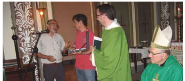
La benedicció la presidia el bisbe Agustí Cortès