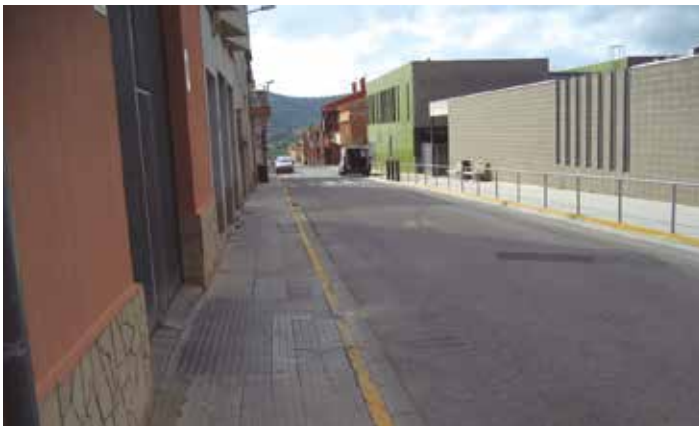
Les obres es preveuen fer durant el desembre