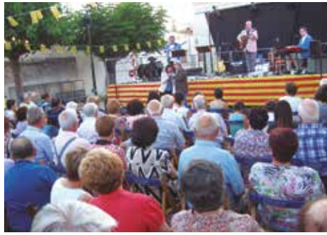
El grup Trams tancava la festa