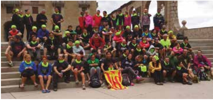
La pràctica totalitat dels inscrits van arribar a Montserrat

La Caminada popular de Moja a Montserrat s'ha consolidat com una activitat lúdica de referència a Olèrdola en l'inici de l'estiu. Dissabte 28 de juny a la tarda, amb sortida des de la plaça Tedéum, 106 persones inscrites van afrontar el repte d'arribar l'endemà a primera hora del matí al monestir de Montserrat. Ho van assolir la pràctica totalitat, gràcies a la preparació conscient que portaven. Però també va influir en aquest èxit l'acurada organització, que no va deixar marge per a improvisacions i que parteix d'una concepció de l'activitat com a proposta de lleure i no competitiva.