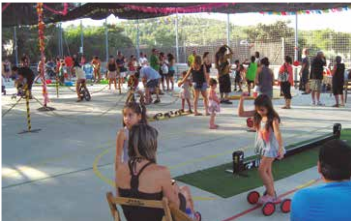
Les activitats vinculades amb el circ van ser un dels centres de la festa

Un dels principals objectius que perseguia l'Àrea de Cultura de Can Trabal durant la Festa Major era el de reunir a diferents generacions en els seus actes, celebrats el darrer cap de setmana de juliol. El propòsit s'ha assolit i en forces dels actes, especialment dissabte a la nit, la Festa Major va convocar a veïns de totes les edats.