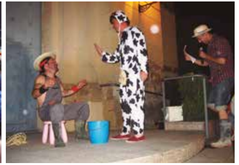
Els Diables van disfressar de vaca a l'alcalde

La Comissió de Festes de Moja ha ofert una valoració inicial molt satisfactòria de la Festa Major, que vivia els seus actes del 20 al 27 de juliol. La participació de veïns per sobre de les previsions es va notar en actes com el cinema a la fresca, el dimarts 22, o bé en l'esmorzar popular de dissabte. També va funcionar amb un ampli seguiment el concert de gralles de dimecres i el de jazz de dijous. Des de la Comissió també han posat l'accent en la gran resposta de públic al pregó i en el manteniment de l'aposta de la nit de dissabte, amb la Banda del Drac a la rambla Pau Casals.