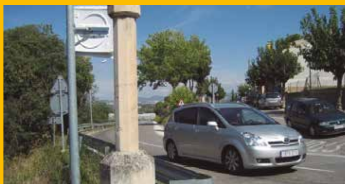
Compte enrere per a construir la rotonda d'accés a Moja