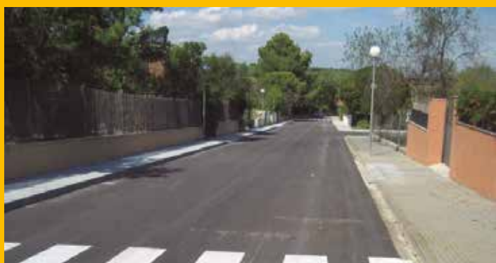
Finalitzen les obres al carrer Major