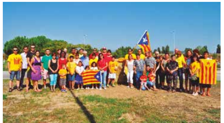
Una trentena d'entitats d'Olèrdola s'han adherit al compromís amb el 9N

cador de la capacitat organitzativa i de convocatòria de l'ANC d'Olèrdola. Van desplaçar a 109 persones en tres autocars, amb sortides des de Moja, Sant Miquel i Sant Pere Molanta. N'haguessin omplert un autocar més si s'hagués satisfet totes les peticions que van rebre.