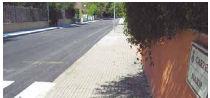
Acabar la urbanització del carrer era un compromís del govern municipal