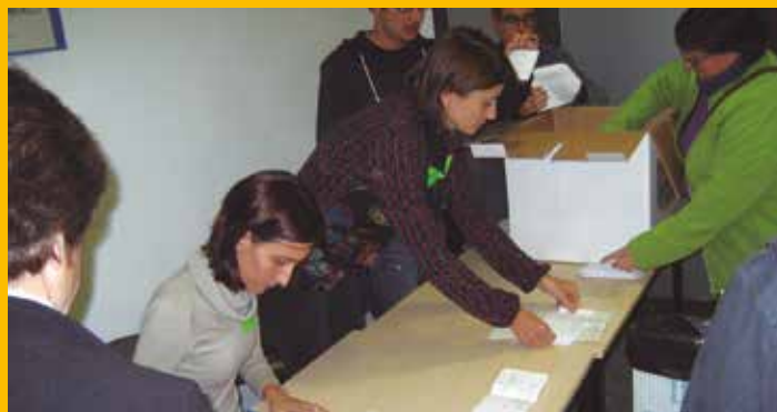
Participació i absència d'incidents en el 9N