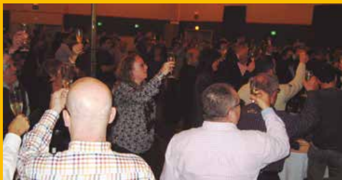
El Molanta celebra 50 anys