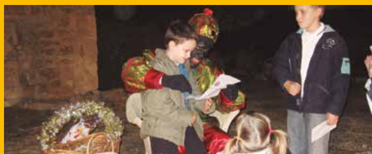
Preparats per viure Nadal, Cap d'Any i Reis