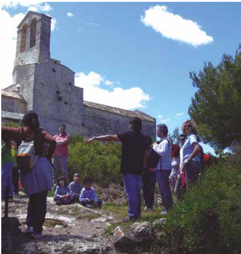
La visita repassa la importància d'Olèrdola durant el segle XI

La Trobada d'Olèrdola és una excel·lent oportunitat per a conèixer la gran riquesa patrimonial que conté el Conjunt Monumental. Per a fer-ho de forma lúdica i distesa, però rigorosa, els assistents de la Trobada tenen l'oportunitat de participar en una de les visites guiades que realitza Triade, l'empresa de Serveis Culturals que dinamitza les activitats al Parc d'Olèrdola. La visita que ofereixen en aquesta 35a Trobada s'ha programat diumenge 31 de maig, a les 11 del matí. Serà "Olèrdola, la ciutat medieval del segle XI". La inscripció prèvia s'haurà de fer al Centre d'Interpretació i l'activitat és gratuïta.