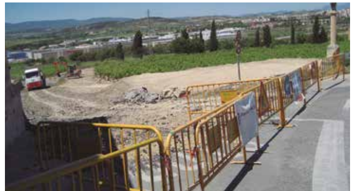
En els tres mesos que duren les obres, els vehicles hauran de sortir de Moja per la Vinera o el carrer del Camp

Els treballs estan finançats en la seva totalitat per la Diputació de Barcelona.