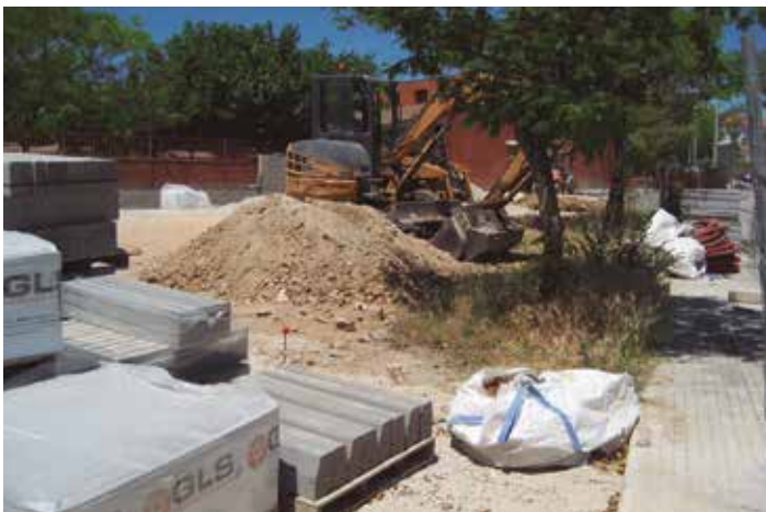
Les obres de la plaça Llevant es preveuen completar abans d'acabar el mes de juny

L'Ajuntament d'Olèrdola va adjudicar les obres per un preu de 76.136 euros, amb el finançament extern de gairebé el 100% de l'import.