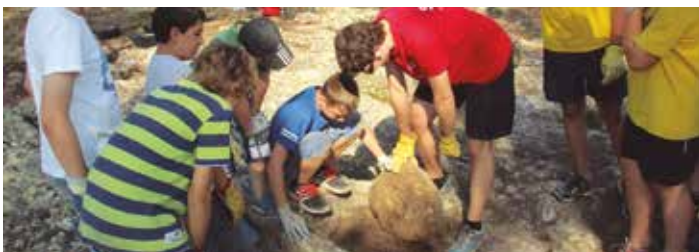
Joves del municipi han pogut fer d'arqueòlegs

Fer d'arqueòlegs en un dels jaciments medievals de referència del país. Gràcies al primer "Arqueocasal", això és el que han pogut fer una desena de joves a la zona del Pla dels Albats del Conjunt Monumental d'Olèrdola. L'activitat s'ha realitzat durant dues setmanes, del 29 de juny al 10 de juliol, i ha comptat amb joves d'edats compreses entre els onze i els 16 anys. La segona de les setmanes compartien tasques amb els arqueòlegs professionals i els estudiants universitaris que assumeixen la campanya d'excavacions planificada fins el 30 de juliol a l'església de Santa Maria del Pla dels Albats.