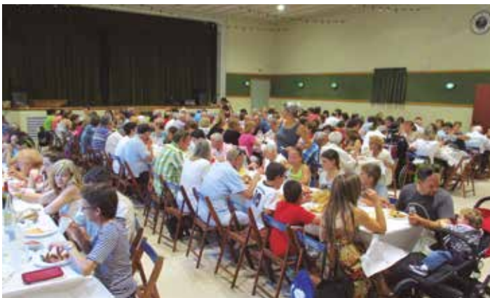
La paella reunia a 250 persones

Amb prop de 250 persones, el local estava ple per a la paella. La Trobada començava el dia anterior a la tarda, després de l'espectacle fet al poble dins del festival EVA, amb una excursió pels voltants del poble. En acabar, es va fer un sopar picnic a la Sala, amb karaoke i bingo. L'endemà es va servir xocolatada i es va procedir a l'exhibició de balls del municipi, incloent les coreografies del grup de Carnaval i dels Gatzara country.