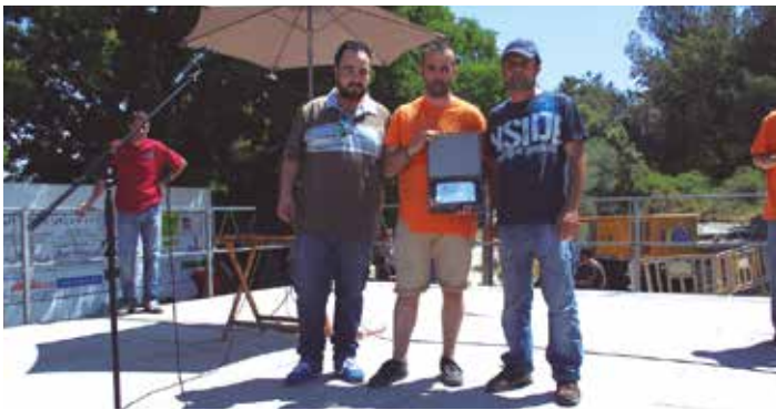
La Plana Rodona celebra el seu 30è aniversari