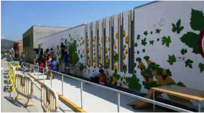
El mural es feia el darrer dia del curs

El divendres 19 de juny l'escola Rossend Montané va aprofitar el darrer dia del curs per acomiadar la imatge grisa de la seva façana. Amb la implicació de tota la comunitat educativa, sota el guiatge del taller "Recursos per emportar" de l'escola d'Art Arsenal de Vilafranca, es va pintar un mural en la façana principal de l'edifici de l'escola, la que dona al carrer Wilson.