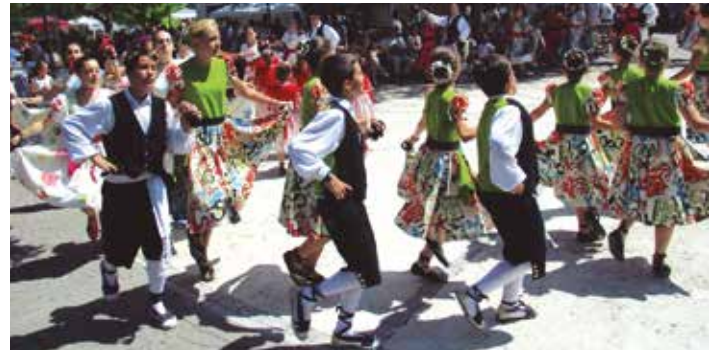
El ball de gitanes de Lliçà d'Amunt

Oferir un programa d'activitats variat i ben atractiu ha estat clau a l'hora de convertir Firamercat de Sant Pere Molanta en un nou èxit de convocatòria i organització. La 19a fira d'antiguitats, articles de segona mà i artesanian tenia lloc diumenge 28 de juny, amb la participació d'una seixantena de paradistes i la programació d'activitats paral·leles que van despertar interès i admiració. Va ser el cas de l'actuació del ball de gitanes de Lliçà d'Amunt, que actuava a Sant Pere Molanta amb quatre agrupacions. També va ser molt seguida la segona edició de la trobada de vehicles clàssics i de competició, que va comptar amb 105 inscrits. Els Falcons de Vilafranca van tornar a deixar constància del seu mestratge i van oferir a Sant Pere Molanta construccions espectaculars, entre les que es poden destacar el pilar de 5 aixecat per sota o la pira 6/5.