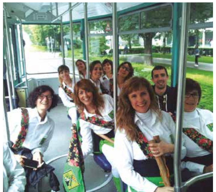
Les bastoneres participaven en la Festa Major dels catalans a Suïssa