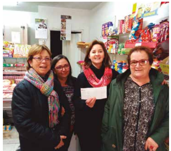
Les organitzadores del Mercat, mostrant el comprovant de l'ingrés

El grup de veïnes del poble de Moja que organitzen el Mercat Solidari de Nadal ha lliurat a Creu Roja de l'Alt Penedès la recaptació obtinguda. Es tracta de 283 euros amb 60 cèntims, una quantitat inferior a l'assolida en l'edició anterior, en bona part degut a que durant el mateix dia del Mercat Solidari, el 13 de desembre, també Moja acollia activitats solidàries vinculades amb la Marató de Tv3. El Mercat Solidari consistia en posar a la venda a molt bon preu productes cedits pels veïns. La roba i les joguines que es van rebre i no es van vendre seran lliurades a Caritas i els llibres a la biblioteca de l'escola Circell de Moja.