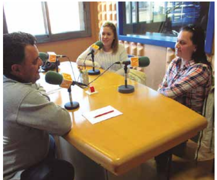
L'actual Junta feia una crida també a través de la ràdio municipal

L'actual Junta espera que hi hauran joves al poble disposats a agafar el relleu i a garantir la continuïtat del Grup de Joves.