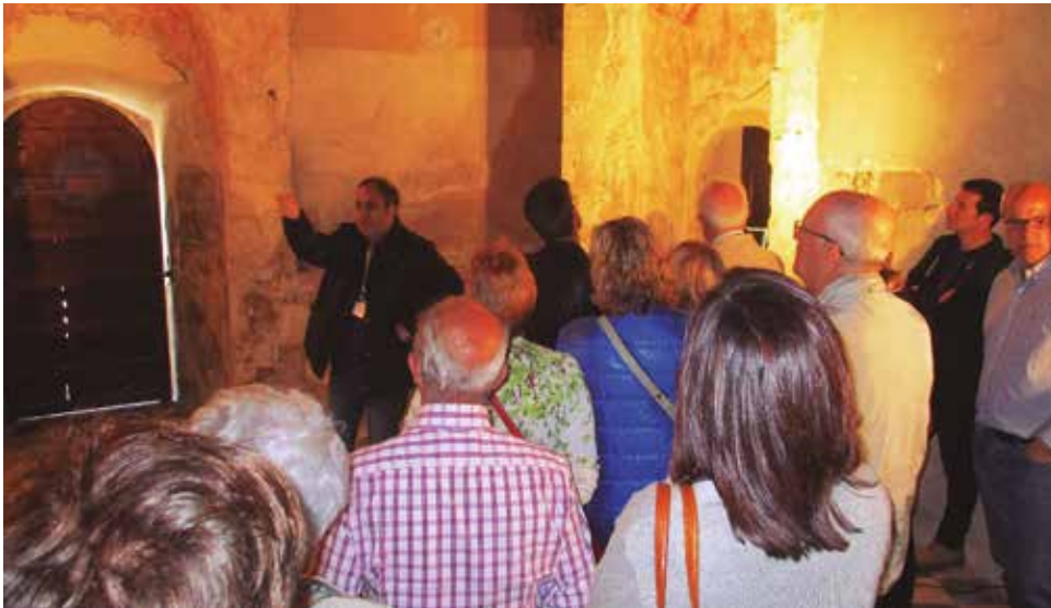
El 24 d'abril es van oferir 4 tornos de visites guiades

Són poques les oportunitats que hi ha per a visitar l'interior de la capella del Sant Sepulcre, el temple romànic situat entre la Serreta i el poble de Sant Miquel d'Olèrdola.