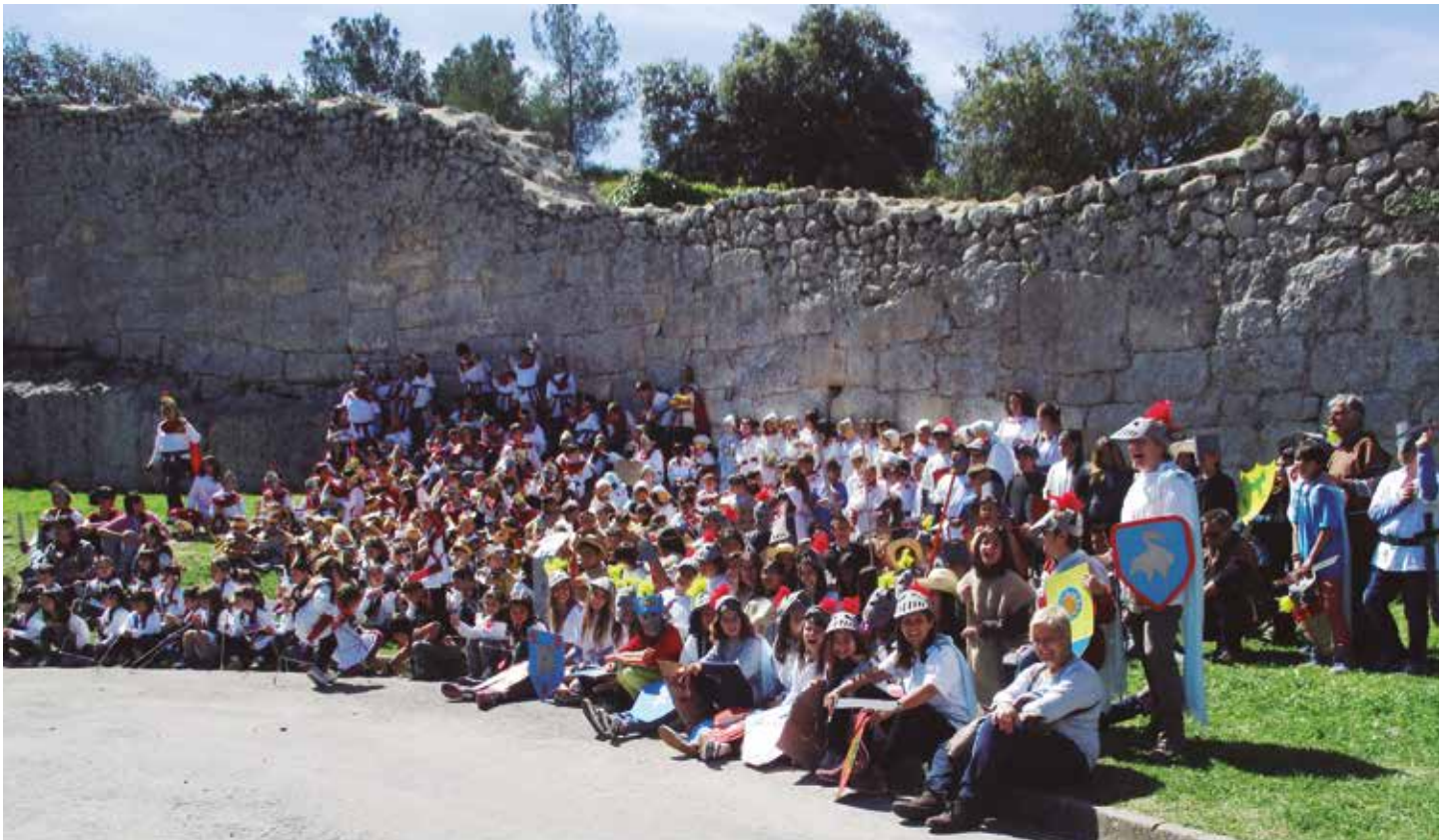
La sortida al castell culminava el projecte "Olèrdola, temps era temps"

Els alumnes de tots els cursos de l'escola Circell de Moja, des de P3 a 6è, compartien dimarts 26 d'abril al matí una sortida del tot excepcional. Tota l'escola es desplaçava fins al castell d'Olèrdola per a viure la culminació del projecte "Olèrdola, temps era temps", que aquest curs han treballat per a conèixer la història del municipi. En diferents espais del conjunt monumental, els alumnes van anar escenificant aspectes que recreaven diferents etapes històriques.