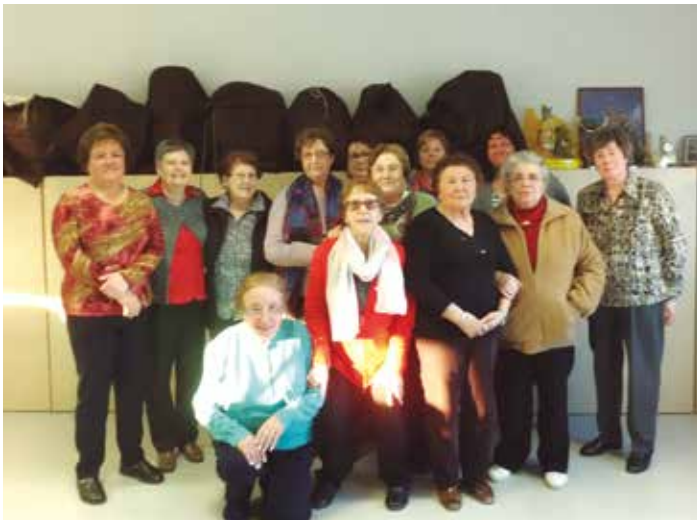
Les puntaires compartien un berenar d'aniversari a La Xarxa

A l'Escola de Puntaires d'Olèrdola li agrada celebrar els seus aniversaris. L'any passat complien dues dècades d'activitat i van voler que la festa fos més rellevant, organitzant una trobada al Local Nou de Moja per a subratllar el rodó aniversari. Aquest 2016, any del 21è aniversari de l'Escola, la celebració no ha tingut tanta projecció i ha tornat a recuperar el caràcter habitual més intern. Així, les puntaires es reunien el passat 2 d'abril per a compartir un berenar al Centre Cívic La Xarxa. Durant la primavera l'escola de puntaires acostuma a acumular moltes sortides. Aquests darrers dies una de ben excepcional ha estat la seva presència en la tercera Trobada Internacional feta a Arenys de Mar, el diumenge 3 d'abril. Per les properes setmanes, una de les cites destacades que preparen és la seva assistència el proper 5 de juny a la Trobada General de Catalunya de puntaires, que enguany es farà a Ripoll. En aquesta trobada es preveu reunir a prop de 3.000 puntaires i des d'Olèrdola s'organitza un desplaçament en autocar.