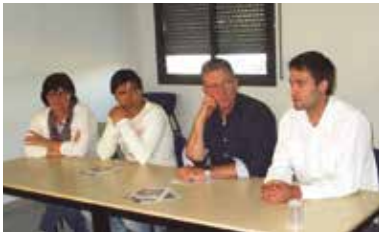
La presentació es feia el 17 de maig

No deixar escapar l'oportunitat de conèixer de manera directa la història del municipi. Aquest va ser un dels missatges més destacats adreçats als joves que es van transmetre divendres 17 de maig, al Centre Cívic La Xarxa de Moja, durant l'acte de presentació de