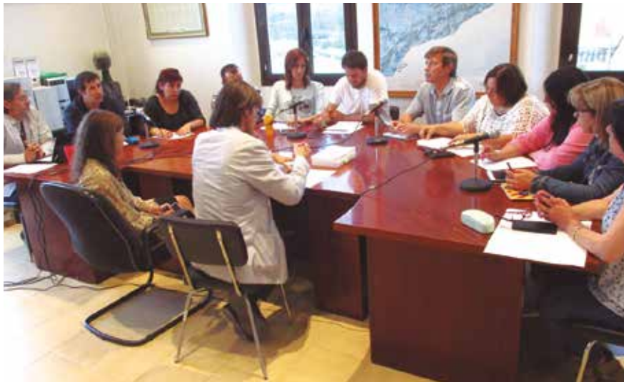
El ple també modificava l'ordenança del cementiri de Moja

El grup municipal de CiU va votar en contra de la modificació i el d'ERC es va abstenir. El portaveu del grup municipal de CiU, Josep Sánchez, considerava excessius els 125.000 euros que es destinaven a senyalitzacions si es sumaven les 3 partides que incorporaven aquest concepte. Des de CiU es defensava que existien altres prioritats d'inversions al municipi, com el nou consultori de Moja o el cobriment de la pista poliesportiva de Sant Pere Molanta. També es dubtava que es poguessin fer dins aquest 2016 projectes com el d'urbanització de l'entorn del carrer Major.