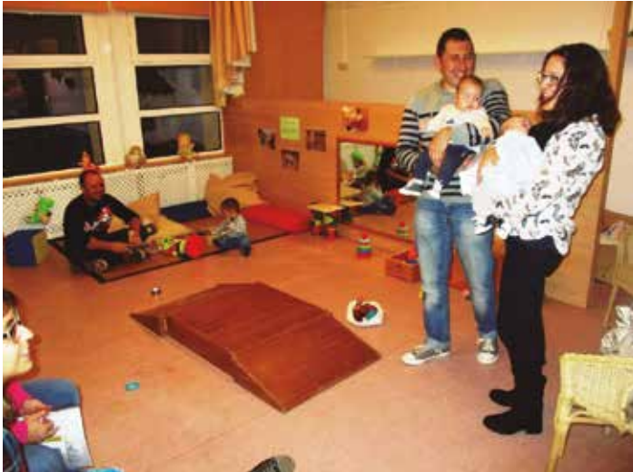
El servei es recupera després d'un curs i un trimestre inactiu

Des de dilluns 9 de gener ha entrat de nou en funcionament l'aula de nadons a l'escola bressol Gotims de Moja. L'aula de nadons acull a infants a partir de les 16 setmanes i es reobre a Olèrdola després d'estar tancada tot el curs passat i el primer trimestre d'aquest per falta de demanda. Atent a una petició de diferents famílies del municipi, el mes de novembre es va fer una preinscripció extraordinària després de comprovar que alguns infants que haguessin estat inscrits havien acabat de néixer el setembre i llavors no reunien el requisit d'edat per estar a l'escola bressol.