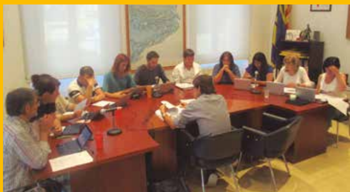
L'Ajuntament amplia subvencions per promoure l'ocupació