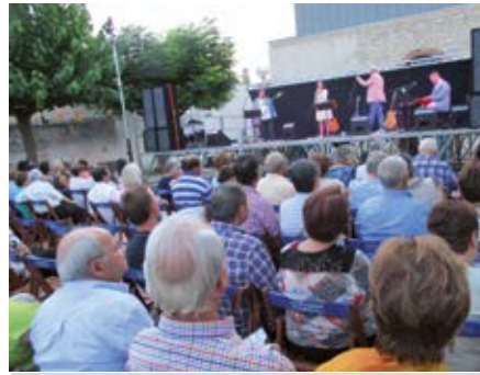
L'Ajuntament passa a assumir la contractació d'espectacles per les Festes Majors

La modificació del pla estratègic de subvencions es va aprovar amb els vots a favor d'ApO i el PDeCat i l'abstenció d'ERC. Torres exposava que, un cop aplicat el canvi de normativa en la concessió de subvencions durant el 2017, ara es considera oportú incloure alguns canvis com el de contemplar les fires i exposicions que es facin al municipi com un nou eix per a valorar. També s'adapten les quantitats econòmiques i es redueix en 45.000 euros l'apartat de cultura degut a que l'Ajuntament passa a assumir bona part de les despeses vinculades amb la celebració de festes majors al municipi, com pugui ser la contractació d'orquestrats i espectacles, grallers o ambu-