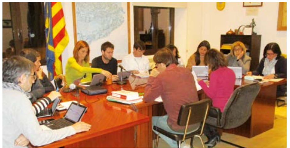
En el ple el govern trasllada informacions d'interès de les diferents regidories

En l'apartat de precís i preguntes, ERC va proposar, en coherència amb una moció aprovada el mes de novembre per unanimitat, que es pengés a la façana principal de l'Ajuntament una pancarta que demani la llibertat dels presos polítics. A preguntes d'ERC, el go-