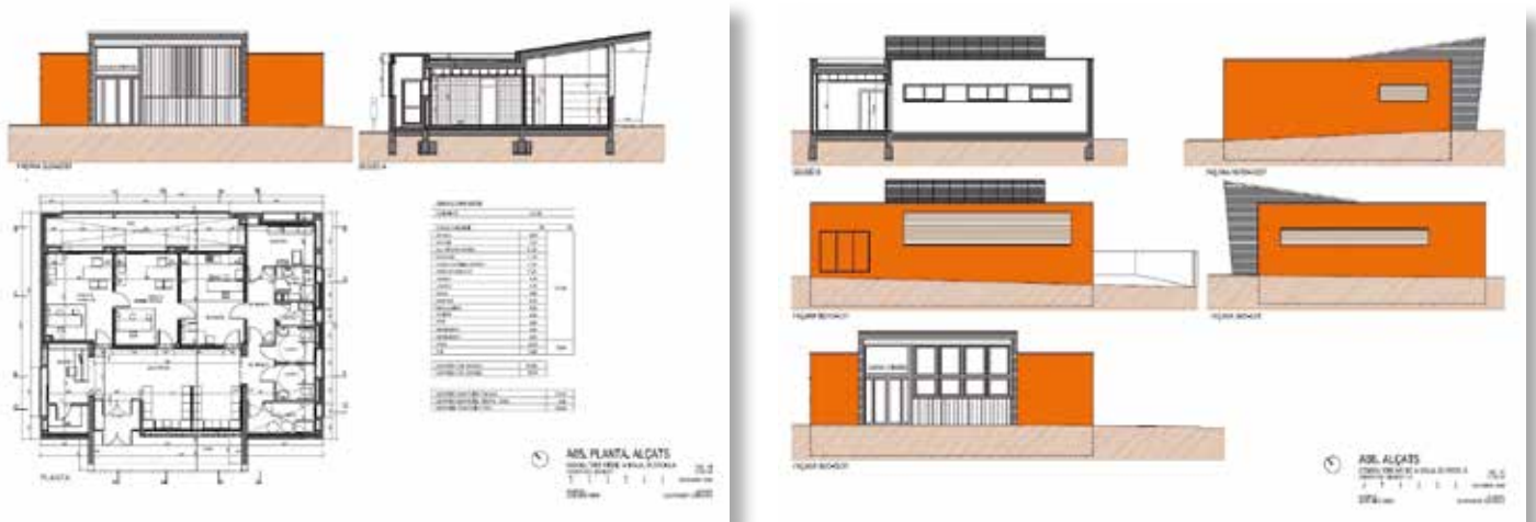
El consultori disposarà de 180 m 2 i tindrà tres sales de consulta

Segons es va poder comprovar en una recent visita d'obres, els treballs de construcció del nou consultori mèdic de Moja avancen a molt bon ritme. Com és visible per a qualsevol veí que passegi pel carrer Sindicat, ja s'ha completat l'estructura i s'estan realitzant els tancaments exteriors d'obra vista de l'edifici. Resta per fer la part dels tancaments interiors, fusteries, instal·lacions, acabats interiors i exteriors. Si no hi ha cap contratemps, la previsió és que l'obra pugui acabar-se el mes de febrer.