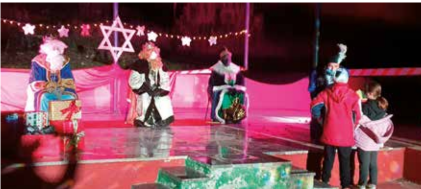
Els Reis d'Orient a Daltmar

Els Reis d'Orient no van faltar a la seva cita anual amb Olèrdola. Abans de repartir regals a les llars del municipi, durant la tarda del dia 5 de gener els vam poder veure presencialment a Daltmar, Can Trabal, Sant Miquel d'Olèrdola, Sant Pere Molanta i Moja. Per les mesures decretades per combatre la COVID-19, les recepcions reials van haver de ser estàtiques i no es van poder fer cavalcades.