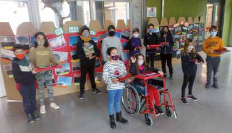
S'han premiat 3 fotografies en cadascun dels tres apartats del concurs

Una vuitantena d'imatges captades per alumnes del centre i les seves famílies han optat als premis del concurs de fotografia de l'escola Rossend Montané de Sant Pere Molanta. L'acte de lliurament dels premis es realitzava divendres 15 de gener al migdia, amb la col·laboració de l'Ajuntament d'Olèrdola, i la mostra amb les obres participants està instal·lada al vestíbul de l'escola.