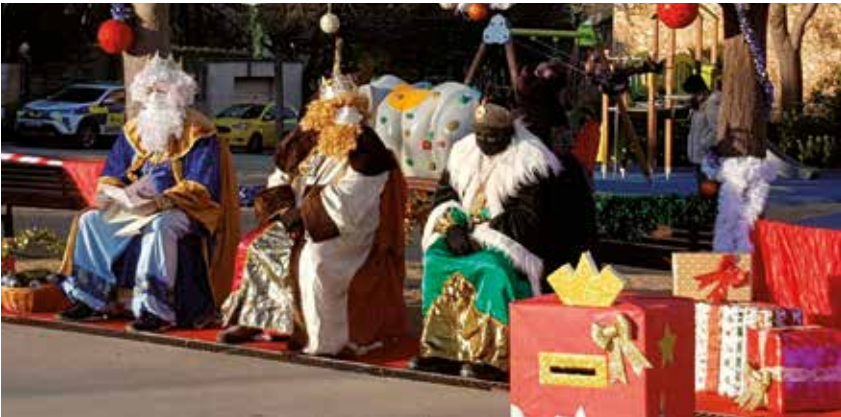
Recepció a Sant Miquel

Els Reis d'Orient no van faltar a la seva cita anual amb Olèrdola. Abans de repartir regals a les llars del municipi, durant la tarda del dia 5 de gener els vam poder veure presencialment a Daltmar, Can Trabal, Sant Miquel d'Olèrdola, Sant Pere Molanta i Moja. Per les mesures decretades per combatre la COVID-19, les recepcions reials van haver de ser estàtiques i no es van poder fer cavalcades.