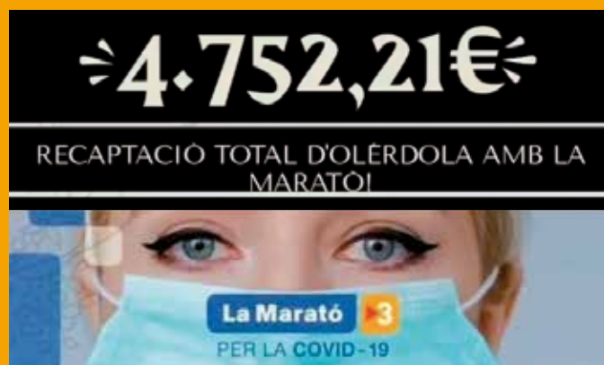
"Olèrdola amb La Marató" recapta 4.752€ | p. 7