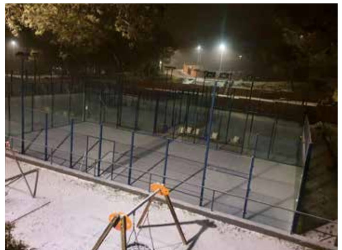
La brigada municipal, actuant a Daltmar durant la matinada del dissabte 9 de gener