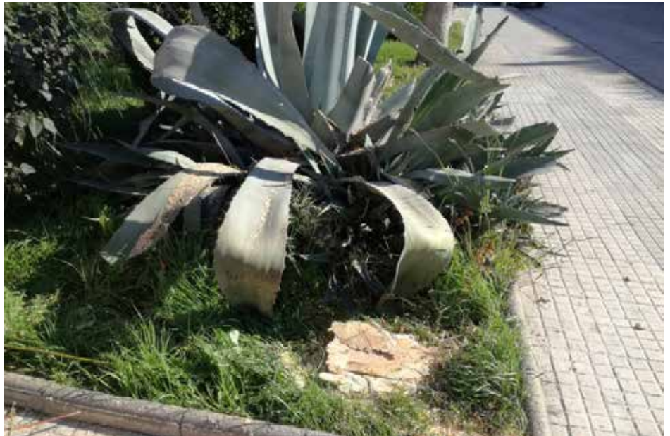
Les tales segueixen les indicacions de l'empresa adjudicatària

En casos com la Vinera s'opta per substituir els arbres talats per exemplars d'espècies autòctones, com és el cas del roure. En el darrer ple municipal de caràcter ordinari, el govern va explicar, a pregunta