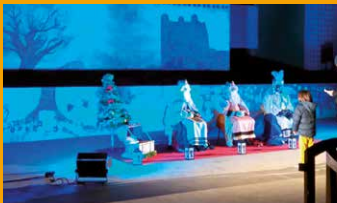
Presència dels Reis d'Orient a Olèrdola amb 5 actes de recepció | p. 3