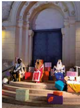
A Can Trabal i a Moja els Reis també oferien recepcions per atendre als infants