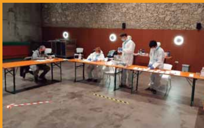
Eleccions excepcionals sense incidències | p. 3