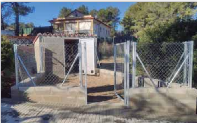
La instal·lació ha estat construïda per la brigada de l'Ajuntament

Per establir la colònia de gats feréstecs a Can Trabal va ser necessària una feina prèvia progressiva d'aproximació fins a vincular-los a la caseta construïda per l'Ajuntament. Durant l'any 2020 es van capturar i esterilitzar 25 gats (17 femelles i 8 mascles) i aquest 2021 es va capturar l'última femella.