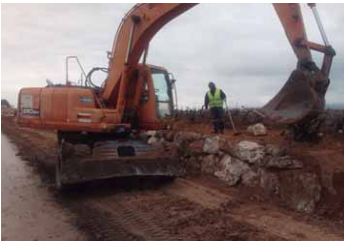
Els treballs es completaran en les properes setmanes

Recordem que l'actuació, promoguda per l'Ajuntament d'Olèrdola, suposarà crear un passeig per a vianants que donarà continuïtat a la vorera del carrer Sant Roc de Sant Pere Molanta fins arribar a les primeres cases del barri de Ferran, connectant així els dos nuclis. Les obres del passeig van ser adjudicades per prop de 109.000€ i es preveu completar-les en les properes setmanes.