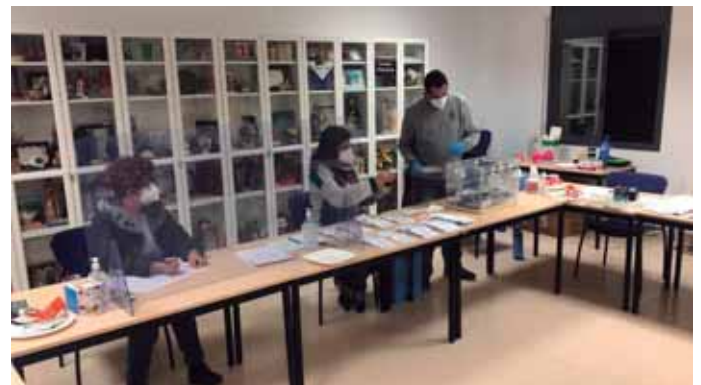
El Centre Civic Gatzara es mantenia com a seu electoral a Sant Pere Molanta