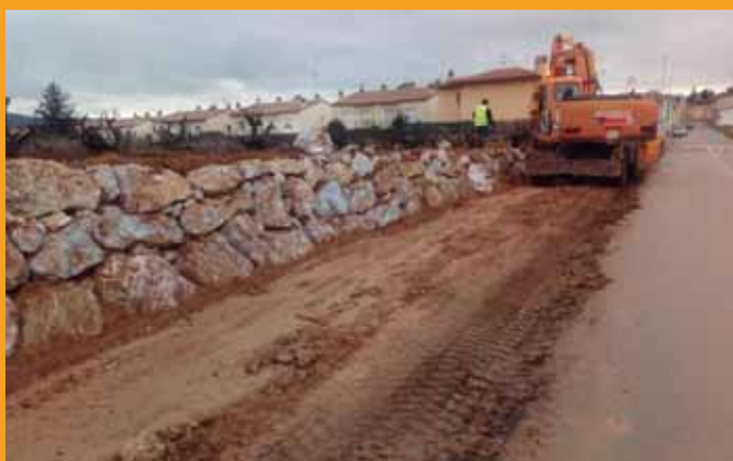
Avancen les obres del passeig de vianants de Sant Pere Molanta al barri Ferran | p. 3

Es commemorarà el centenari de l'inici de les excavacions arqueològiques a la muntanya d'Olèrdola