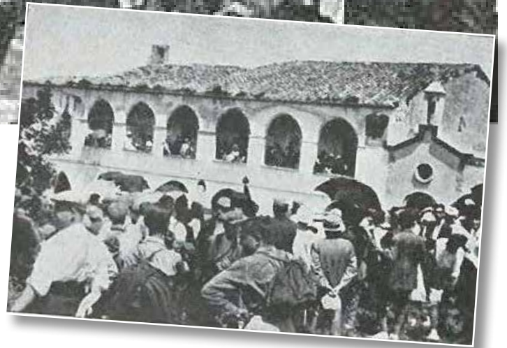
Imatge de l'Aplec, amb la Masia (ara desapareguda) que hi havia a l'entrada del Conjunt monumental

Per assistir-hi des de Barcelona es van organitzar dos trens que van transportar a 1.500 persones i una de les personalitats de l'època que va participar en l'Aplec va ser el poeta Pere Corominas. Properament des de la regidoria de patrimoni de l'Ajuntament d'Olèrdola es preveu organitzar un acte en commemoració del centenari d'aquest històric aplec.