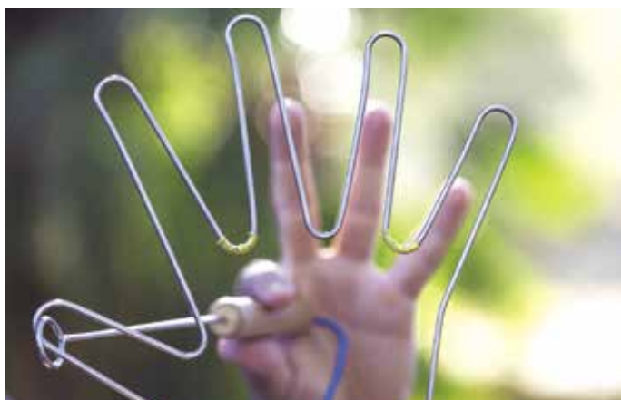
1r premi modalitat "La Matinal", Oriol Domingo