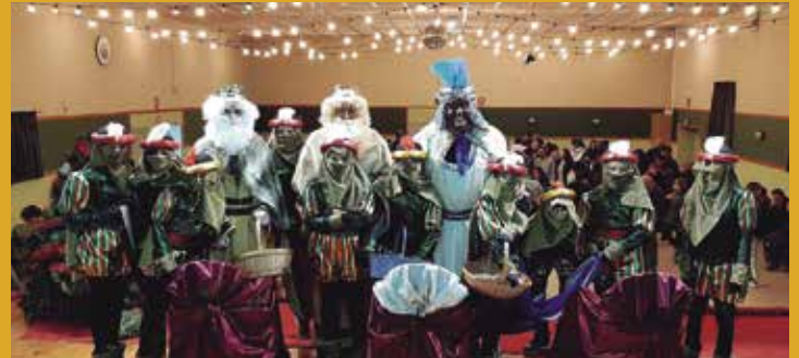
Sant Pere Molanta

Fidels a la seva cita anual, durant la tarda del dijous 5 de gener els Reis d'Orient van arribar a Olèrdola per desplegar la seva màgia i deixar regals.