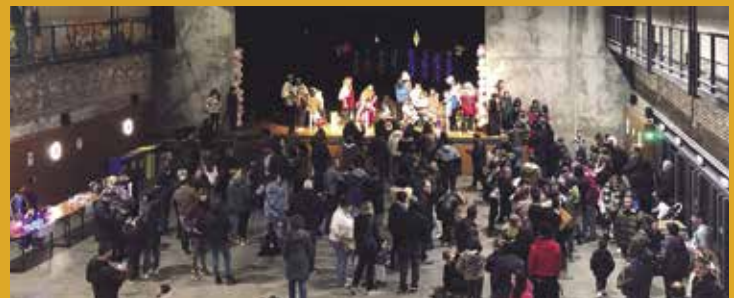
Local Nou de Moja