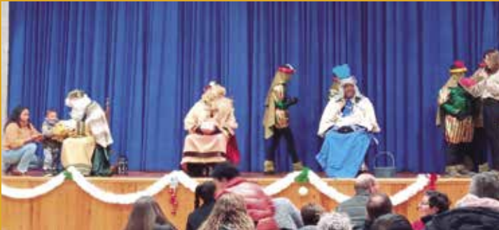
Sant Miquel d'Olèrdola