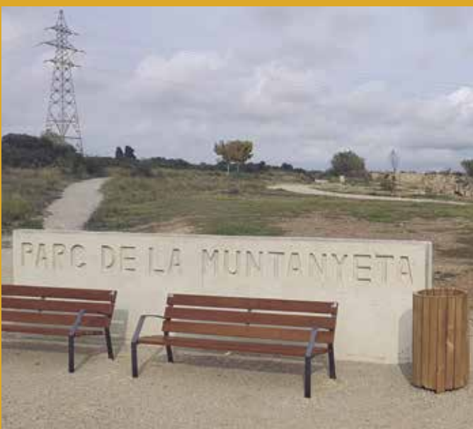
El circuit permanent de running ja està a disposició de la ciutadania | p. 3