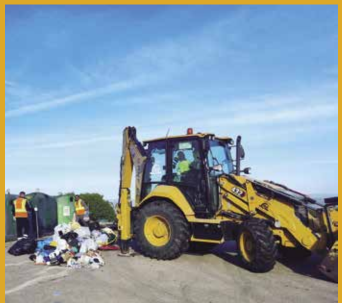
L'Ajuntament actua davant els problemes d'insalubritat per l'acumulació de brossa | p. 3