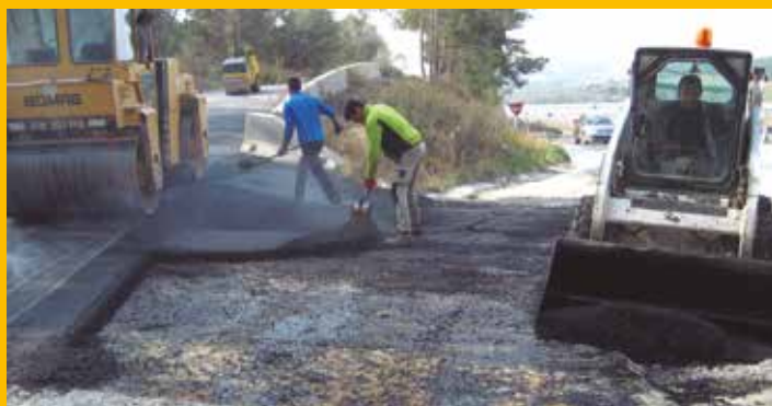
L'Ajuntament arranja camins a la Serreta i Daltmar

S'adjudiquen les obres de la rotonda d'accés a Moja i de la nova plaça de Sant Pere Molanta