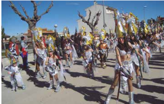
Comparsa del grup de Moja

El grup de Carnaval de Moja, amb "Gel i Foc a Moja", és un dels grups que millors sensacions poden tenir a l'hora d'analitzar el seu pas pel carnaval d'enguany. Han estat dels grups més premiats en les rues del Penedès. Van fer-se amb el primer lloc a Calafell, obtenien el segon a Cunit i també assolien un meritori segon lloc a la rua de divendres de Vilafranca. Per acabar, guanyaven la rua de Santa Fe. En totes aquestes rues, els jurats quedaven captivats per una proposta espectacular inspirada en la sèrie televisiva "Juego de Tronos". A més de la carrossa, amb la gran trona i els dracs com a elements destacats, el grup també ofería una disfressa que cuidava tots els detalls. Del barret, reproduint un cap de drac, en destacaven els ulls il·luminats. Per a molts, tampoc passava desapercebut que els 115 balladors comptaven amb dos dracs més, un en un braç i l'altre en una mà. Les coreografies han estat també un dels punts forts d'un grup que aquest any, per idea i per execució del projecte, ha acaparat molts premis.