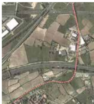
Tindrà 1.400 metres de longitud