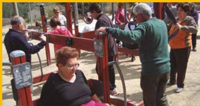
Can Trabal estrena espai de salut i connexió a Internet

La taxa de les llars d'infants es calcularà en funció de la renda familiar