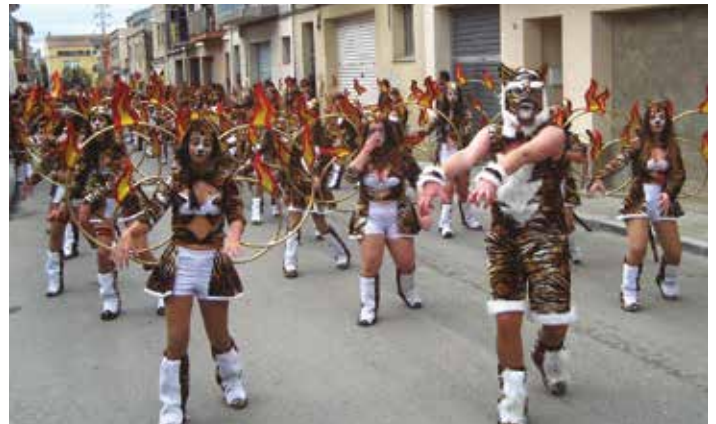
"Tots per un" té la seu a Sant Miquel