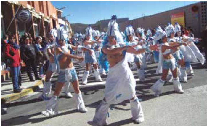
El grup de Sant Pere l'integraven 207 persones

carnaval al Penedès. Van ser primers en la rua del Vendrell i van obtenir el primer premi al concurs del Casino. També van guanyar el concurs de la Ràpita i es van endur el tercer lloc en el concurs de la sala La Flama de Vilafranca. I des d'aquest 2015 cal fet notar que Sant Miquel d'Olèrdola és la seu d'un grup de Carnaval actiu en les rues del Penedès. Es tracta de "Tots per un", un grup implantat primer a Sant Cugat i que fins l'any passat tenia la seva seu als Monjos. Amb la comparsa "Circus", aquest any reunien a 85 persones provinents de diferents localitats de la comarca, incloent veïns de Sant Miquel.