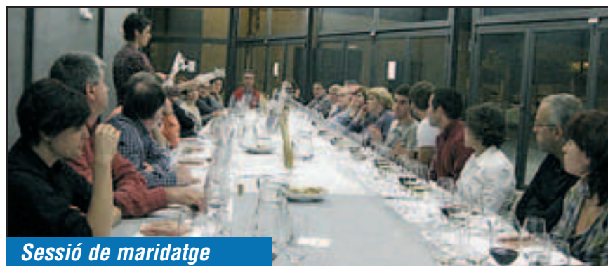
Sessió de maridatge

La novetat d'oferir un taller per maridar vins i caves amb embotits artesans va ser també un èxit. Gràcies a la col·laboració de Cal Feru i d'Embotits Mitjans, 30 persones van poder gaudir diumenge 30 d'octubre, al vespre, d'una sessió que permetia degustar productes de qualitat i descobrir les seves millors i variades combinacions.