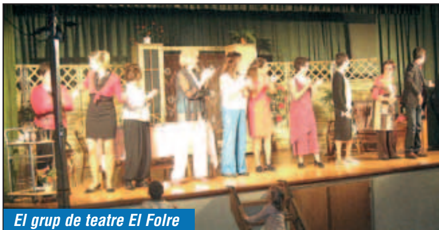
El grup de teatre El Folre

Els actes de la Festa del Most de Sant Pere Molanta, fets durant el primer cap de setmana de novembre, han complert amb les expectatives fixades. En algun cas inclús superant-les gratament, com va ser l'estrena de l'obra de teatre "Les meves veïnes", del grup "El Folre".