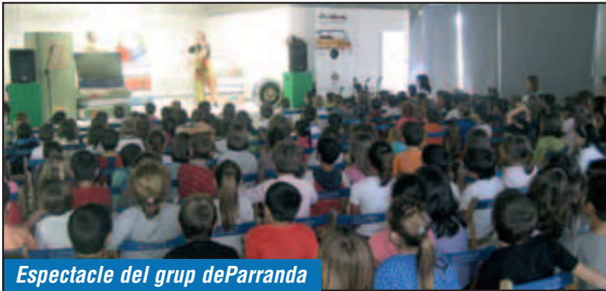
Espectacle del grup deParranda

Cada any, quan arriba la tardor, els bibliobusos porten a terme una campanya de foment de la lectura dins d'un programa adreçat als infants. L'objectiu és interessar els infants al voltant d'un tema i, aprofitant aquest interès, animar-los a llegir llibres, fullejar revistes, mirar pel·lícules i buscar més informació al seu voltant.