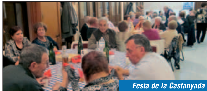
Festa de la Castanyada

Una vuitantena de persones participaven, dissabte 5 de novembre a la tarda, en la Festa de la Castanyada que convocava el Casal d'Avis de Moja. Per un mòdic preu, els assistents van poder gaudir d'un àpat a base de pa amb tomàquet, assortit d'embotits, truita, castanyes, panellets, moscatell, aigua, vi, cava, cafè i licor. La castanyada és una de les celebracions ja clàssiques que ha establert el Casal d'Avis en el seu calendari d'activitats anuals.