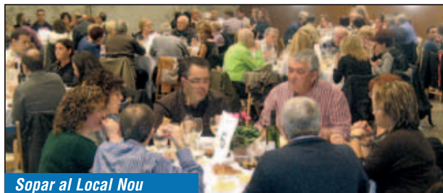
Sopar al Local Nou

La Festa del Most de Moja d'aquest 2011 tenia diversos ingredients però, de ben segur, serà molt recordada per la imatge que presentava dissabte 29 d'octubre a la nit el Local Nou. En el sopar i ball de la Festa del Most hi van acabar participant gairebé 150 persones, convertint així l'acte en tot un èxit de convocatòria que referma l'aposta de la Comissió de Festes d'oferir un sopar de qualitat a l'interior del recuperat i remodelat Local Nou.