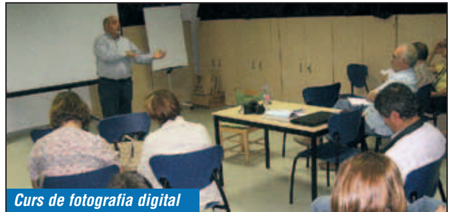
Curs de fotografia digital

Dilluns 17 d'octubre al vespre tenia lloc la primera de les vuit sessions del taller de fotografia digital que, sota l'organització de l'Associació Fotogràfica de Moja, se celebra al Centre Cívic La Xarxa. Les expectatives d'inscripció s'han assolit i hi participen una quinzena de persones. El curs té el propòsit d'oferir els fonaments bàsics per a treure el màxim rendiment a la càmera. Els preus econòmics fan que el taller sigui també un bon mecanisme de captació de socis per a l'entitat.