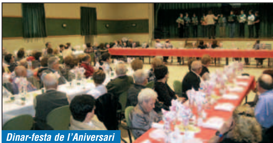
Dinar-festa de l'Aniversari

El Casal d'Avis de Sant Pere Molanta passa per un molt bon moment. Així es va expressar en la celebració del seu sisè aniversari. En el dinar convocat dissabte 12 de novembre per a commemorar aquests sis anys de constitució de l'entitat hi van participar fins a 98 persones i l'activitat es va haver de fer al Casal Molantenc perquè la seu del Casal d'Avis, al Centre Cívic Gatzara, no té la capacitat suficient. La jornada va ser molt més que un dinar compartit en mig d'un gran ambient. També es va poder comprovar la feina feta per la coral del Casal d'Avis i gaudir d'una exhibició de ball country a càrrec del grup SMS, l'entitat que aporta el monitor que dirigeix les classes del grup de ball de country al mateix Casal d'Avis.