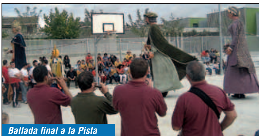
Ballada final a la Pista

Els geganters de Sant Pere Molanta són uns actius ambaixadors del seu poble i del municipi. Realitzen sortides arreu del territori i un dia l'any, durant la seva trobada, conviden a colles que els han anat acollint. Així, la Trobada de gegants de Sant Pere Molanta és un fidel mostrari que permet comprovar aquesta gran activitat dels gegants Pere Moranta i Griselda. Aquesta onzena edició de la trobada, celebrada diumenge 23 d'octubre al migdia, no ha estat pas l'excepció, ans al contrari. Hi havia 8 colles convidades i la seva procedència era ben diversa. Algunes, del mateix Penedès, com les colles de Calafell, Sant Martí o Olesa de Bonesvalls. Però altres també de més lluny, com la del Prat de Llobregat, Breda, els emblemàtics gegantons del Pi de Barcelona, els geganters de Sant Carles de la Ràpita o bé els de Fraga, de la franja de Ponent. Tots ells van protagonitzar una animada cercavila que, com a novetat, finalitzava per primera vegada amb la ballada final a la pista de la nova escola.