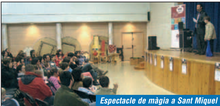
Espectacle de màgia a Sant Miquel

La pluja no va impedir però sí que va condicionar la celebració, diumenge 6 de novembre al matí, de la Festa Major del Parc. Les activitats s'havien de fer al recinte del conjunt històric d'Olèrdola però la meteorologia va obligar a que la programació es traslladés i s'acabés fent a l'interior del local Rossend Montané, a Sant Miquel.