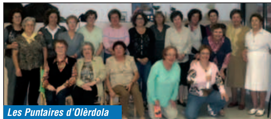
Les Puntaires d'Olèrdola

Dissabte 22 d'octubre l'escola de Puntaires d'Olèrdola celebrava amb un berenar la seva patrona, Santa Úrsula. Va ser al Centre Cívic La Xarxa, a l'espai d'entitats, l'emplaçament habitual de les sessions que fa l'escola a Moja durant la setmana. Hi van participar 22 puntaires i suposa fer una de les tres celebracions a l'any que programa l'escola de puntaires, juntament amb l'aniversari i el final de curs.