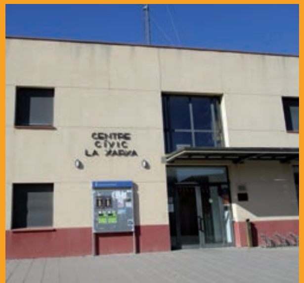
Els serveis es preveu que es traslladin a La Xarxa el mes de gener

L'Ajuntament preveu que el trasllat dels serveis a La Xarxa ja estigui completat durant el mes de gener. L'alcalde preveia que les obres de reforma i ampliació de la seu de l'Ajuntament podrien estar acabades entorn el mes d'octubre de 2020.